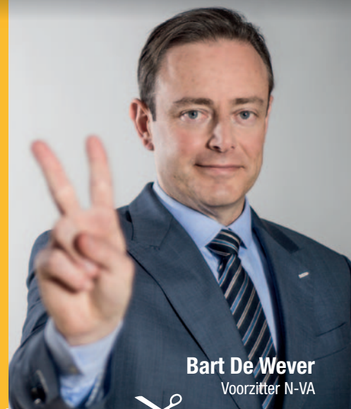
Bart De Wever Voorzitter N-VA