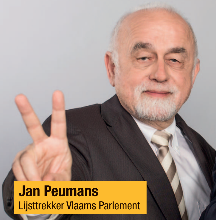
Jan Peumans Lijsttrekker Vlaams Parlement