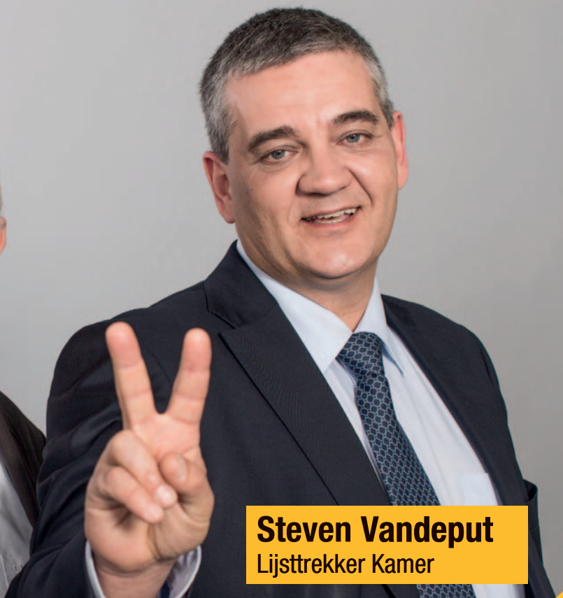
Steven Vandeput Lijsttrekker Kamer

Politici zijn er voor de burgers, de verenigingen, de ondernemingen, en niet omgekeerd. Politici moeten zuinig en doeltreffend omspringen met de beschikbare overheidsmiddelen, met úw geld.